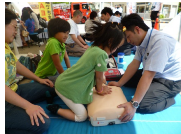
(吹田駅救急フェアの様子)

救急隊員や、応急手当普及員の資格を持つJR西日本の駅社員及び乗務員が、心肺蘇生法とAEDの使用方法を指導します。今年度の5月、6月開催の4駅で約1,200名の方に参加いただき、約300名に救命処置を体験していただきました。