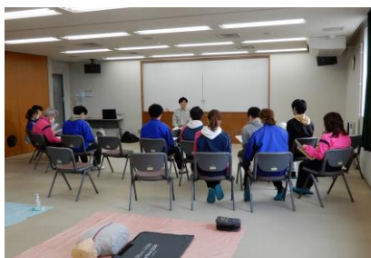
助成先団体の活動の様様