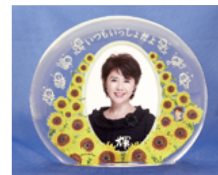
いつもいっしょだよ基金 モニュメント

新たに基金を発足させ、東日本大震災でご家族を亡くされた1,000名のご遺族に対して、今、モニュメントを差し上げる活動をさせていただいています。